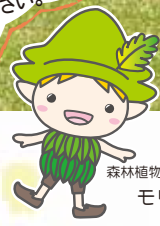
森林植物園キャラクター モリンくん