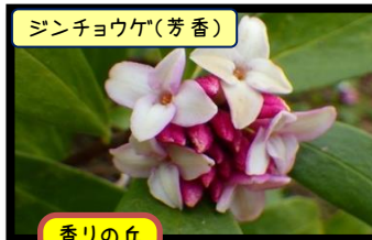
ジンチョウゲ(芳香)