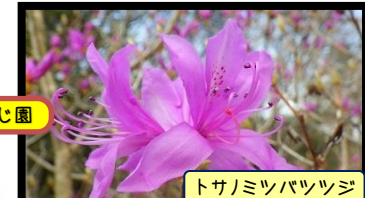
トサノミツバツツジ