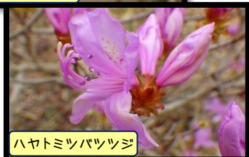
ハヤトミツバツツジ