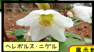
ヘレボルス・ニゲル