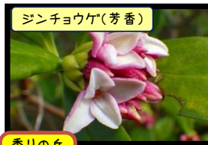
ジンチョウゲ(芳香)