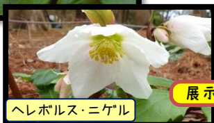
ヘレボルス・ニゲル