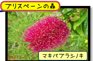
アリスパーンの森