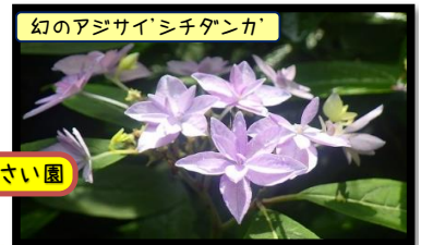
幻のアジサイ'シチタンカ'