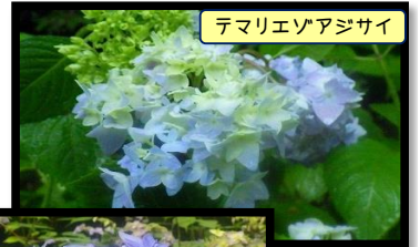
テマリエゾアジサイ