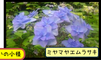
ミヤママユムラサキ