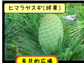
ヒマラヤスギ(球果)