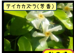
テイカカズラ(芳香)