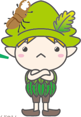
しんりんしよくぶつえん 森林植物園マスコットキャラクター モリンくん