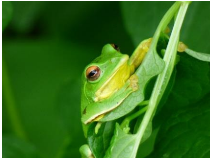
神戸市レッドテータフック Bランク