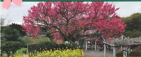
30th 記念イベント「芝生で遊ぼう! 親子祭り」5月5日(月・祝)

【入園料】無料 【駐車場】バス 2,000円(要予約) / 普通車 500円 〒654-0163 神戸市須磨区緑台 アクセス/神戸市営地下鉄「総合運動公園駅」下車