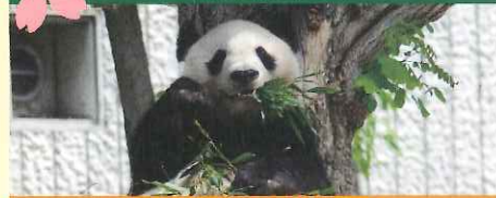
夜桜通り抜け 4月上旬3日間

【入園料】大人 600円 / 中学生・小学生・幼児無料 【開園時間】9:00～17:00(入園は16:30まで) 【駐車場】0～2時間まで30分ごと150円、 2～4時間まで30分ごと100円、 4時間を越える30分ごと50円