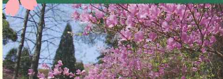
新緑つつじ・しゃくなげ散策 4/19(土)～5/18(日)

【入園料】大人 300円 / 小・中学生 150円 【開園時間】9:00～17:00(入園は16:30まで) 【駐車場】バス 2,000円 / 普通車 500円 【休園日】水曜日(新緑つつじ・しゃくなげ散策期間中は無休) 〒651-1102 神戸市北区山田町上谷上字長尾 1-2 アクセス/神戸電鉄「北鈴蘭台駅」より 無料送迎バス約10分