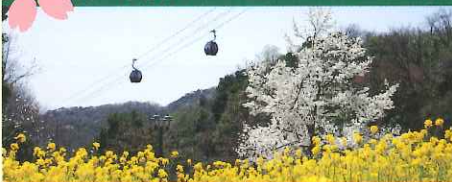
Herb Show 2014 3/21(金・祝)～6/1(日)

【利用料】往復大人 1,400円 / 小・中学生 700円・ 片道大人 900円 / 小・中学生 450円 <ナイター料金> 往復のみ大人 800円 / 小・中学生 500円 ※4/1からの増税により、価格が変更となる場合がございます。