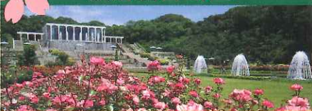
スプリングフェスティバル 2014 3/21(金・祝)～5/6(火・休) 春のローズフェスティバル 2014 5/10(土)～6/29(日)

【入園料】大人 400円 / 小・中学生 200円 【開園時間】9:00～17:00(入園は16:30まで) 5/3(土)～5/6(火・休)のみ夜間開園あり 【駐車場】バス 2,000円 / 普通車 500円 【休園日】木曜日(4/3・5/1・5/22・5/29は臨時開園) 〒654-0018 神戸市須磨区東須磨 1-1 アクセス/山陽電車「月見山駅」「須磨寺駅」下車徒歩約10分 JR「須磨駅」下車 市バス約10分 神戸市営地下鉄「妙法寺駅」下車 市バス約12分