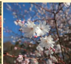
ジュウガツザクラ