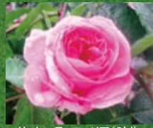
ロサ・ケンティフォリア (Old)