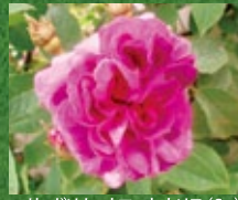
ロサ・ガリカ・オフィキナリス (Sp)

※ロサ・エグランテリアは葉に香りがある珍しい野生種で、秋にはローズヒップが真っ赤に色づきます。 ※ローズヒップは主に春咲きの野生種に実ります。なお、一般に食用になるローズヒップはロサ・カニナの実を指します。