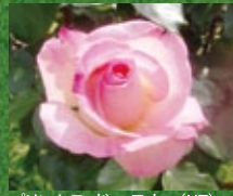
プリンセス・ドゥ・モナコ (HT)