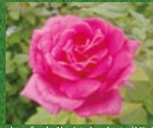
オーバーナイト・センセーション (Min)