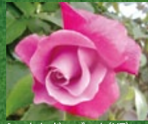
シャルル・ドゥ・ゴール (HT)