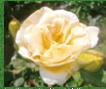
レディ・ヒリンドン (Old)