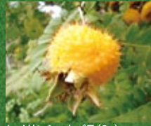
ヒメサンショウバラ (Sp)