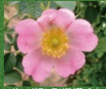
ロサ・エグランテリア (葉・Sp)