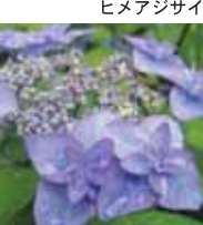
ミヤマアエムラサキ